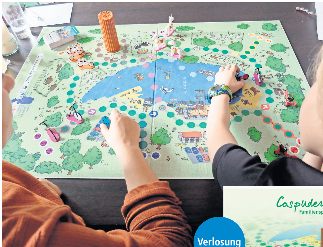
Großes Spielfeld, bunte Figuren: Das Brettspiel Cospudener Wettlauf überzeugt mit Spielidee und liebevollen Details.

Die Kinder beginnen sofort, mit den Spielfiguren herumzuspielen, den Einhornern, Tretmobilen und Tandems. Bald entwickelt sich ein rasanter Wettlauf um den See. Die Spielregeln orientieren sich stark an „Mensch ärgere Dich nicht“, doch diese regionale Variante hat einen entscheidenden Unterschied, die für viel Dynamik sorgt: Per Schiff „MS Cospudener“ oder Floß über den See kann